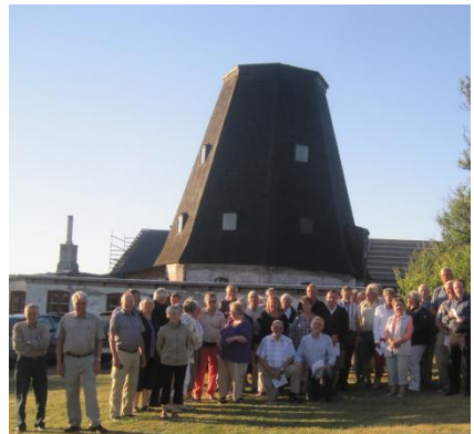
Klubben samlet til sommerafslutning ved Lyshøj mølle, juni 2014.