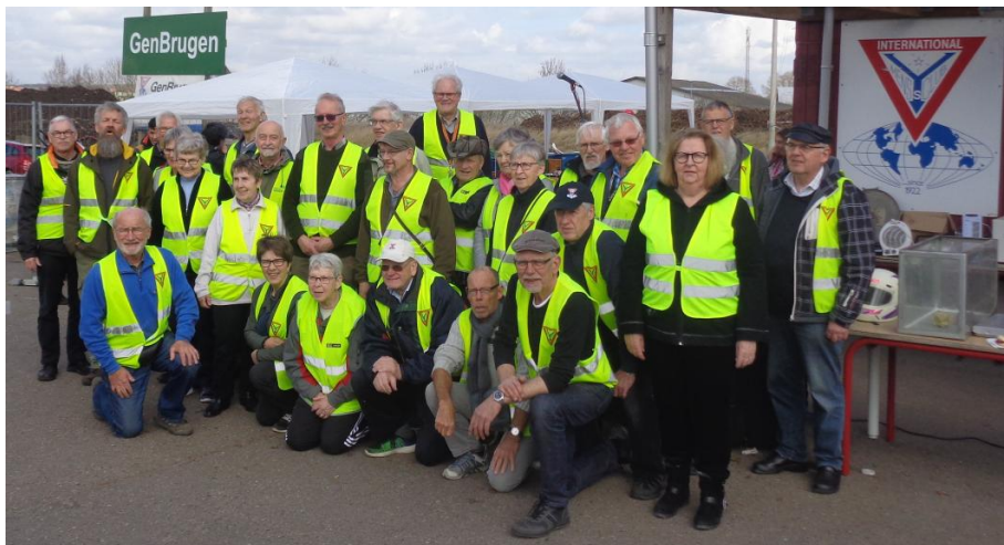
Holdet på dagen hvor vi sagde farvel til GenBrugen.