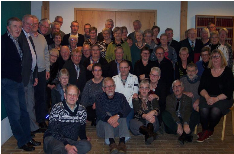
Foto taget i anledning af en hilsen til venskabsklubben i Stokke, Norge.