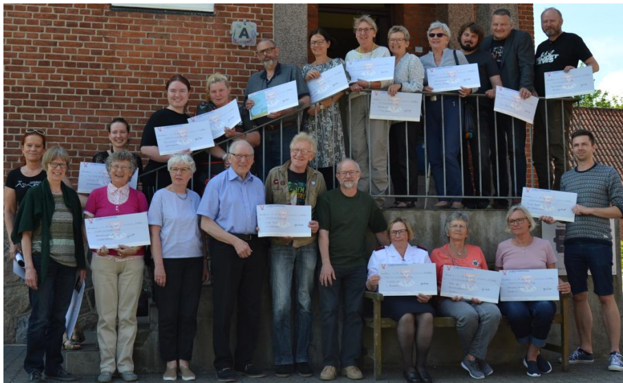
Repræsentanter for modtagere af GenBrugens overskud.